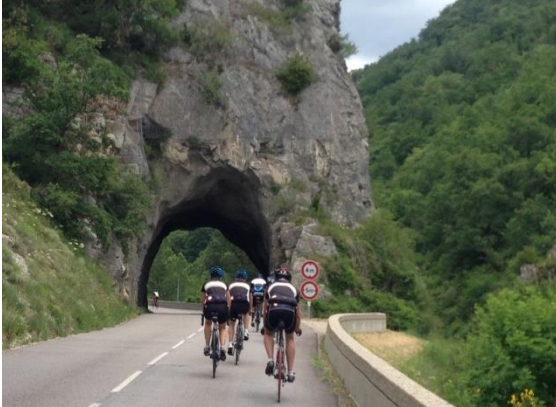
Midden in de Drôme

Ook de fietsers van de 40 en 70 km worden woensdag getrakteerd op schitterende tochten midden in de Drôme.