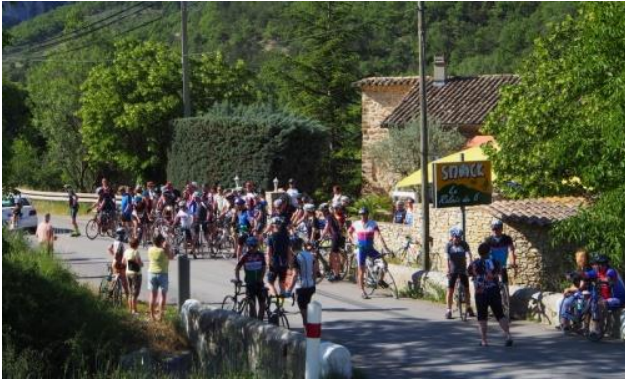
Niet meer op de weg staan