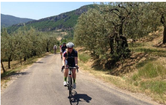
Koersen door een olijvenboomgaard

De DrômeTour wordt als fietsevenement vanaf het begin zeer hoog gewaardeerd. Het onderwerp “De Drôme als fietsgebied” bijvoorbeeld wordt door de deelnemers op een schaal van 0 tot 10 met ruim een negen gewaardeerd. De verscheidenheid aan tochten in het Provençaalse spreekt tot de verbeelding.