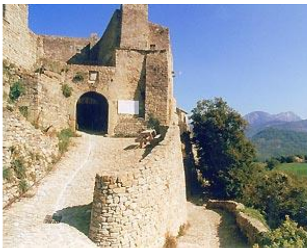
De Drôme met zijn fraaie kastelen

Tussentijds en na al het feestgedruis ga ik graag wat fietsen. Goed ingepakt en genietend van de frisse winterlucht. Vaak laat ik dan mijn gedachten wat gaan en mijmer ik bijvoorbeeld over de DrômeTour of de Drôme met zijn fraaie kastelen.