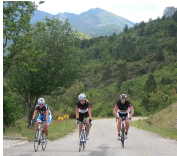
Zondag verrassende 70 km route